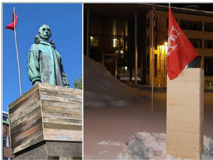
STATUE-STUNT: I 2019 ble Roald Amundsen-stauten delvis innbygget og transformert. Mandag markerte Nordting sin tilstedeværelse utenfor Nord-Troms tingrett med å bygge inn statuen av Fritjof Nansen.