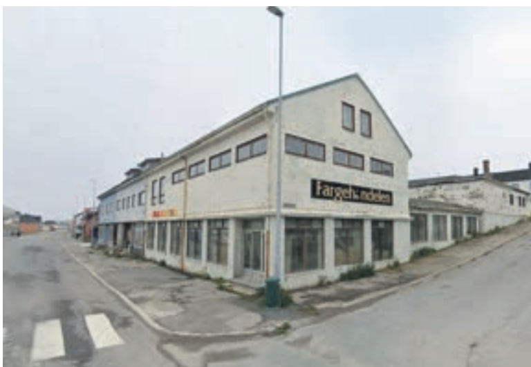
SKIFTET EIER: 8 eiendommer skiftet eier i forrige måned.

Følgende eiendommer har skiftet eier i Vardø kommune forrige måned.